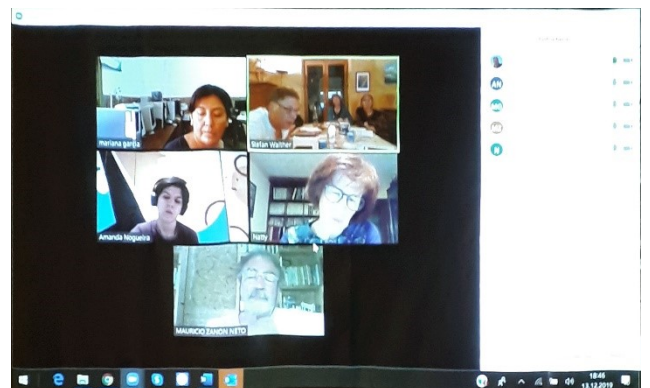
La vidéoconférence du soir, projetée sur un drap