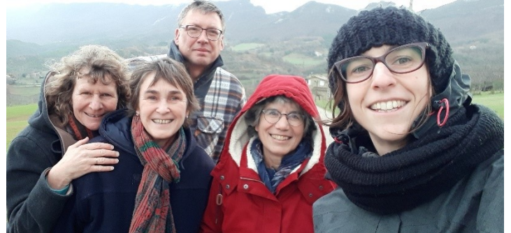
L'équipe présente au Conseil de décembre 2019