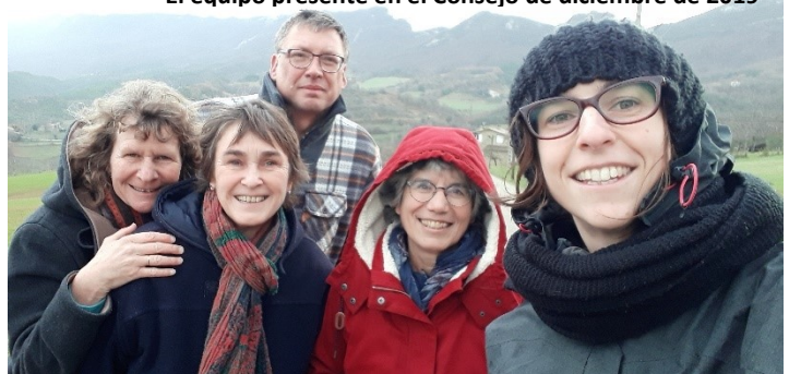
El equipo presente en el Consejo de diciembre de 2019