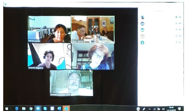
Videoconferencia vespertina proyectada en una hoja